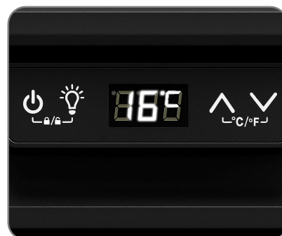
Écran tactile LED