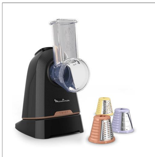
Fresh Express Twist, Découpe-légumes, Service direct, 3 fonctions Découpe-légumes DK8638E0