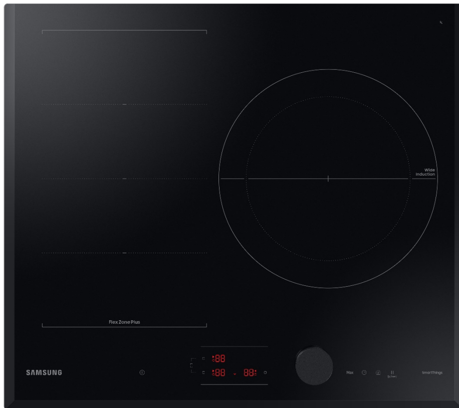
TABLE À INDUCTION – 3 FOYERS DONT 1 FLEX ZONE PLUS