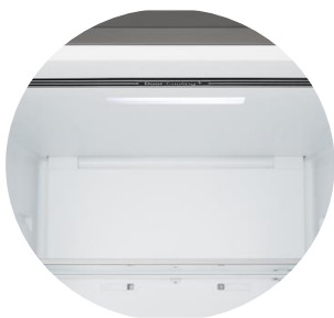
Door Cooling™ &amp; Soft LED