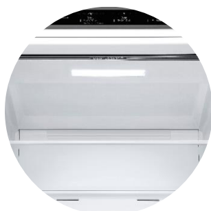
Door Cooling™ & Soft LED