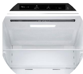
Display intérieur discret